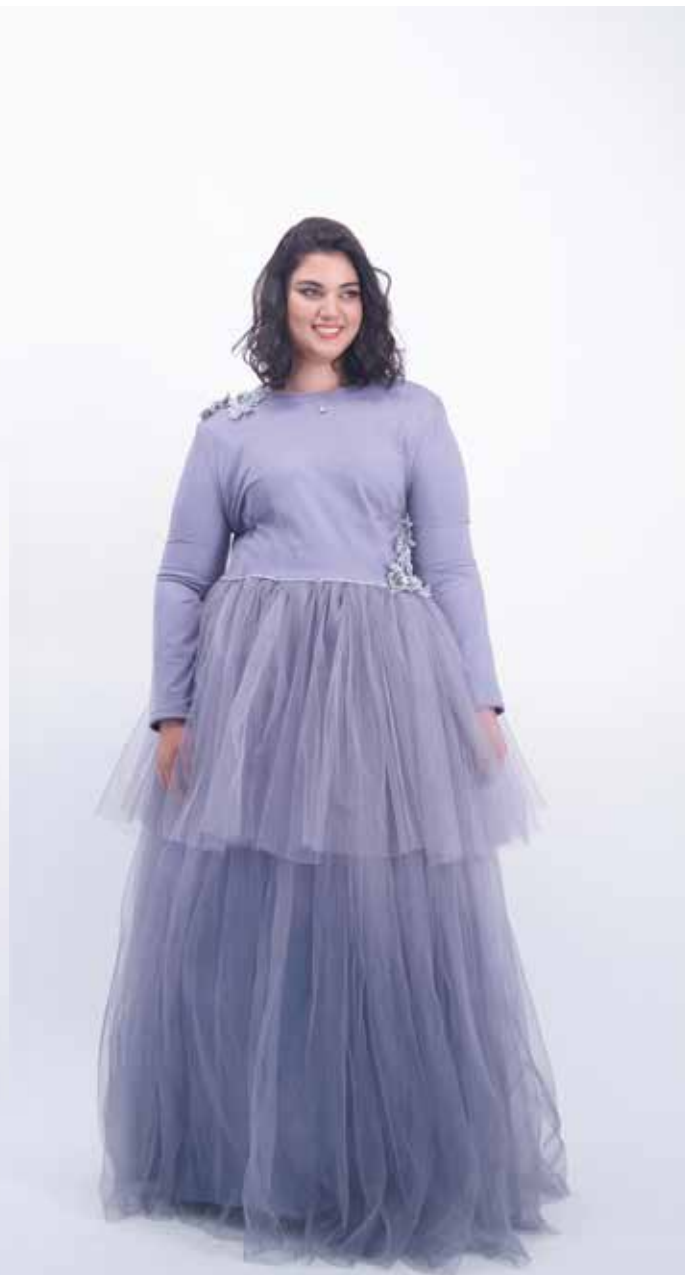
מתאים למידות : 44-52