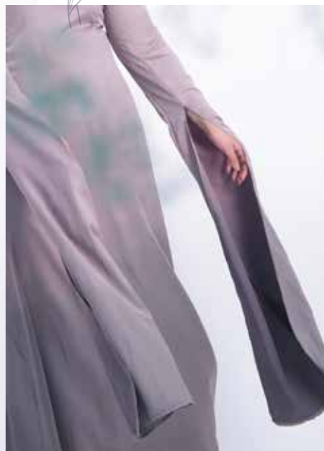
מתאים למידות : 44-52