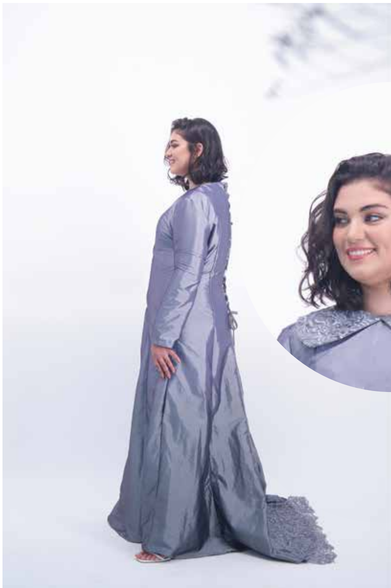
מתאים למידות : 44-54